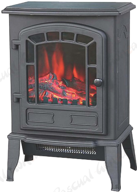
CHIMENEA ELECTRICA RUSTICA PG117601