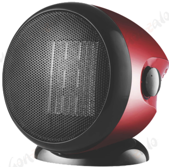
ESTUFA RED 1.500W PG117600